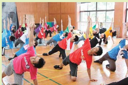
いよいよ合宿開始