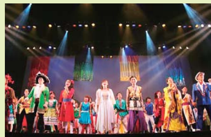
100日後の今、舞台へ・・・