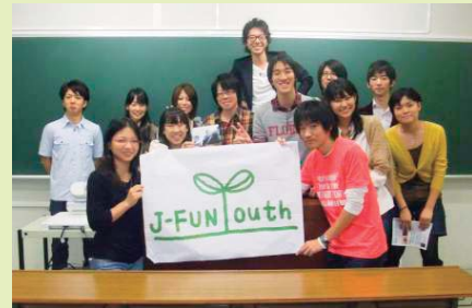
文化祭でのイベント 無事終了！