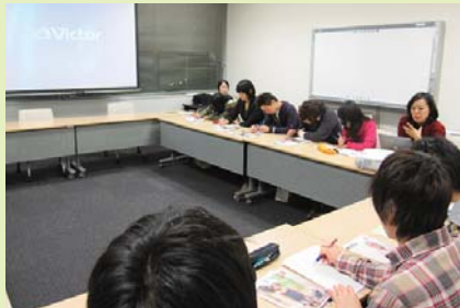
ユニクロ社員の方を招いて勉強会

J-FUNユース http://www.unhcr-youth.com/index.html