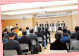
「学校支援地域本部シンポジウムの開催」

区教育委員会では、地域代表・社会教育関係者・学校長・コーディネーターなどが委員となる「学校支援地域本部連絡会」を開催し、「学校支援地域本部」事業の進捗状況の評価及び検証や区全体規模の今後の方向を議論してきました。