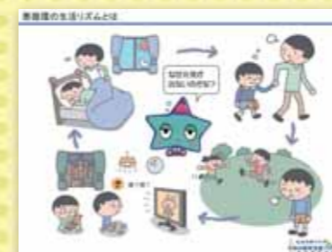
悪循環の生活リズムとは