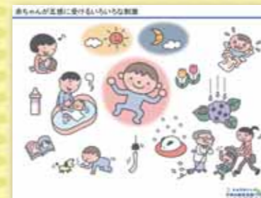
赤ちゃんが五感に受ける様々な刺激