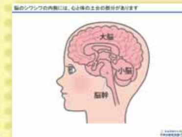
脳のシワシワの内側には、心と体の土台の部分があります