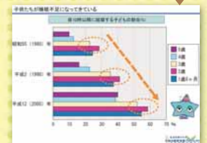
子供たちが睡眠不足になってきている