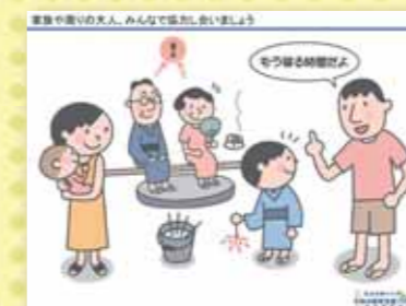
家族や周りの大人、みんなで協力しましょう