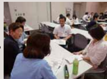
小中学校におけるコーディネーター対象研修「コーディネーター・ミーティング」

防災教育など学校と地域や団体とをつなげた取組を支援する〔地域・団体連携協働部会〕