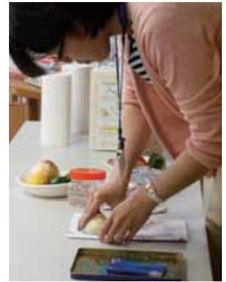
タマネギに絵の具を塗って、ペタペタ。どんな模様ができるかな？