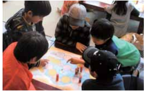
手作り双六、楽しいよ！