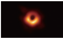
M87 中心ブラックホール画像

●講演会「大宇宙、ブラックホールへの挑戦」 本間希樹(ほんままれき)先生が、人類で初めて撮影に成功したブラックホール研究プロジェクトや、これまでの研究などについてお話しします。