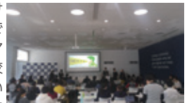
高校生世代チャレンジプログラム

●高校生世代チャレンジプログラム 「2020年に向けて「いま」きみができること」をテーマに未来を担う高校生世代が「いま」互いを認め合い、未来につなげるために、ベストを尽くしてできることは何か、何をすべきなのかを考え、社会課題への取組や社会貢献活動などのイベントなどを自ら立案・企画から計画の作成、活動計画や資金計画を作成し、実施までの一連の取組を全て行う社会的起業(ソーシャルビジネス)体験プログラム。修了書授与。審査により各種受賞。 日 時：令和元年11月3日(日)から2月16日(日)(全11回) 対象：高校生世代又はそれに準じる年齢の個人又は団体 募集人員：20名 参加費：無料。弁当持参。 申込み：ホームページのエントリーフォーム又は、申請書(ホームページから入手)を東京スポーツ文化館へメールで送付する方法で、10月21日(月)までにお申込みください。申込の際に参加への抱負や意気込みを記載していただきます。応募多数の場合は参加意欲の高い方を選出します。詳細はホームページを御覧ください。