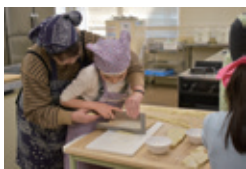
親子で雑作りに挑戦

●ひとり親家庭のための1DAYプログラム レクリエーションや調理プログラムを通じて、大人は交流会、子供たちはボランティアリーダーと遊ぶことを通じて、家族間の交流をたくさん行うプログラムです。 日 時：令和元年12月8日(日) 対象：5歳～6年生のひとり親家庭の親子(子供は兄弟姉妹での参加も可) 募集人員：20組 参加費：お一人様1,100円 申込み：往復はがき(消印有効)に郵便番号、住所、参加者全員の氏名(フリガナ)、年齢(学年)、電話番号を御記入の上、令和元年11月5日(火)までにお申込みください。応募多数の場合は抽選。