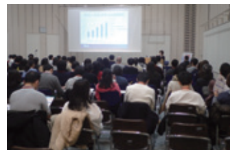
平成30年度留学説明会の風景

■問合せ先 東京都立中央図書館 情報サービス課 〒106-8575 東京都港区南麻布 5-7-13 電 話：03-3442-8451(代)