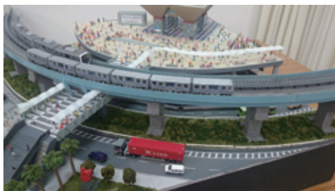
青稜中学校・高等学校 鉄道自動車部制作ジオラマ

日 時：令和2年1月18日(土)から3月8日(日)まで 平日10:00～20:45 土日祝日は17:30まで 休館日：令和2年2月6日(木)、21日(金)、3月5日(木) 会 場：東京都立中央図書館 4階企画展示室 入場料：無料