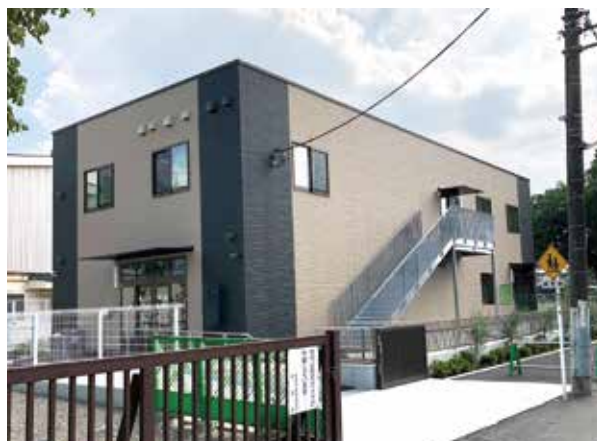
コミュニティハウス

コミュニティスペースが創り出す様々な取組が地域の人々のつながりを深め、子供から高齢者まで幅広い層の地域参加を生み出し、今後の新たな地域コミュニティづくりのモデルとなるよう、東京都は清瀬市と連携して、この取組を支援していくとともに、その取組の成果を研究・分析することを通じて、都内各地に地域学校協働活動の輪を広げていきたいと考えています。