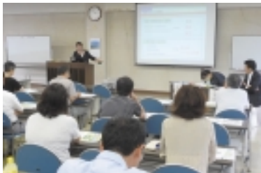
講義「地域の活力を学校支援に生かそう」

あきる野市では、昨年度から小学校1校で学校支援ボランティア推進協議会事業が始まりました。研修には、当該小学校の関係者を始め、放課後子供教室関係者やPTA関係者、おやじの会関係者、自治会役員、青少年委員など様々な立場の方が参加しました。コーディネーターの役割や学校支援の基本について学び、あきる野市の地域特性を生かしたこれからの学校支援活動を考えました。