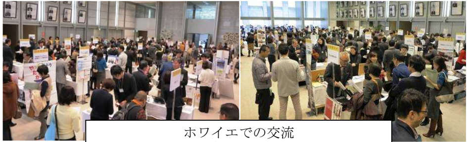
ホワイエでの交流