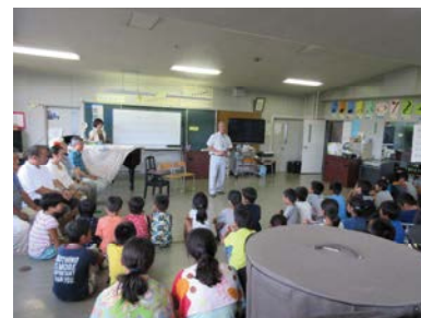
ユネスコスクール『立志学校』 〈ゲストティーチャー型〉

学校支援コンシェルジュが、地域人材等を学校に紹介したり、地域と連携した取り組みをコーディネートしたりすることにより、各学校における教育活動の質の向上が図られた。また、地域の方との交流を通して、児童・生徒の地域に対する理解や愛着が一層深まった。