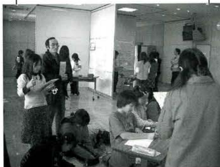
発表を見ている子どもたちとお世話になった専門家の方