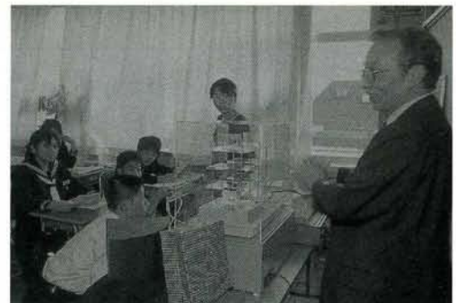
耐震構造の模型を持参して建築原理を説明する講師。