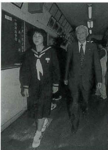
講師の方々を出迎え、各教室へご案内。

企業経営者の方々の話をじかに聞くことによって、社会や時代の流れを学び、働くことの意義や仕事の楽しさ、苦しさ、生きがいを知る。