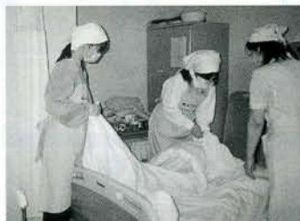
病院でベッドメイキング