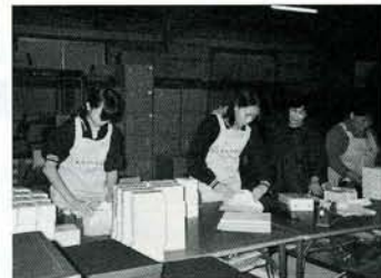
贈答用品の包装をする